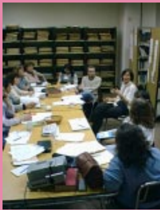
Participantes del Curso sobre Conservación

nes limitadas. Para que las bibliotecas y archivos cumplan efectivamente su misión de conservar los papeles que albergan, sus edificios deben ofrecer un hábitat sano. Este calificativo es aplicable a un medio donde los niveles de humedad ambiente, temperatura, luz, ventilación y limpieza, sean los adecuados